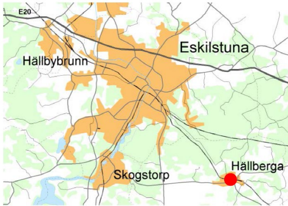
1 Läge av Hällberga inom Eskilstuna kommun