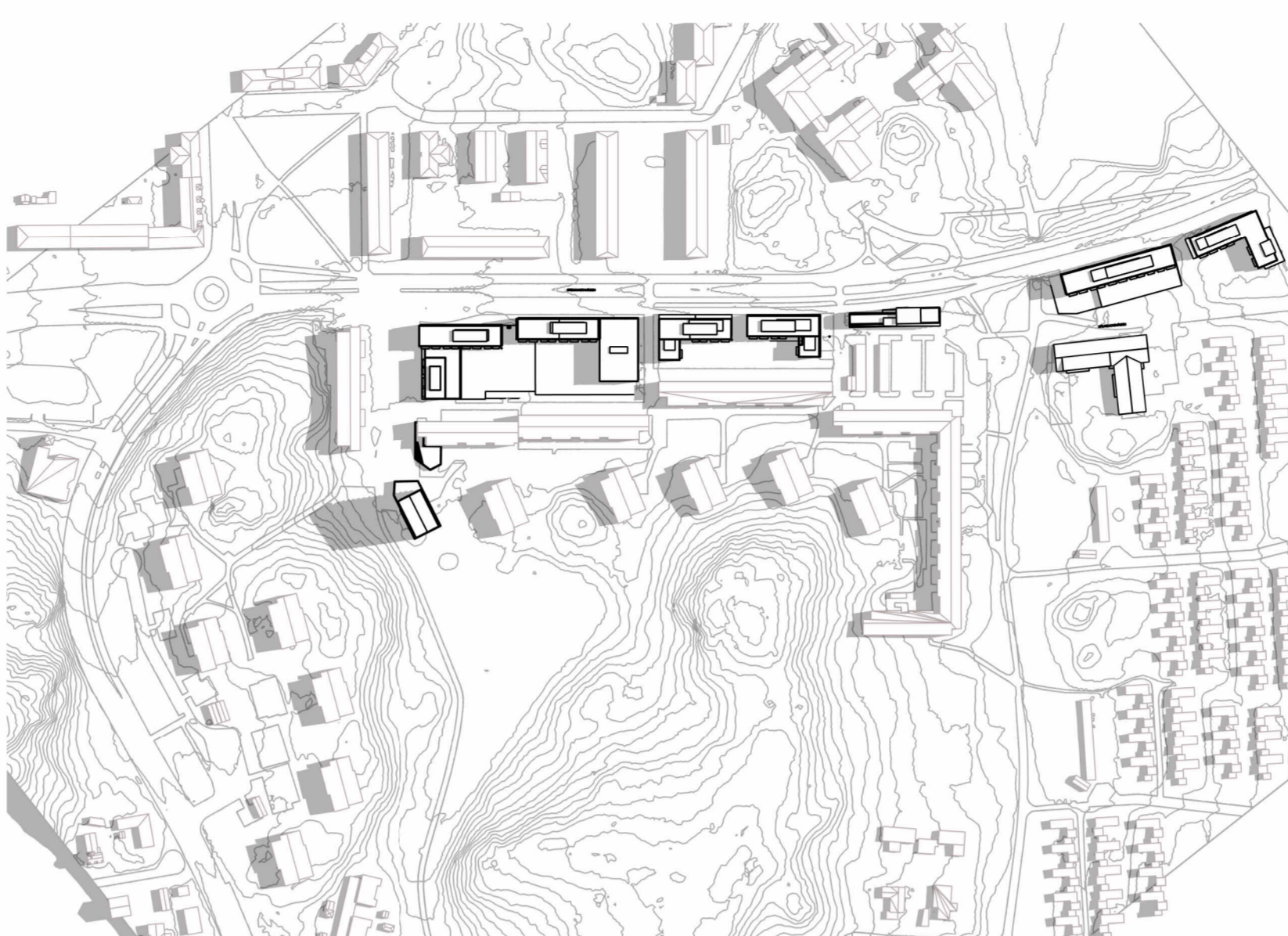
21 JUNI - KL. 9 - Plan