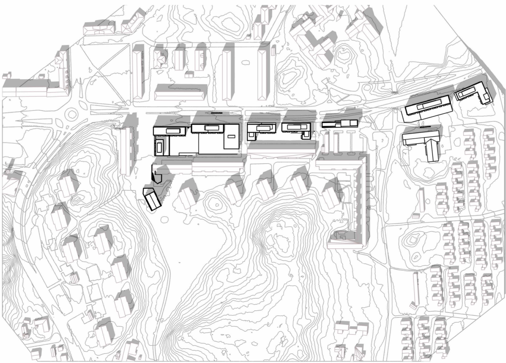
21 JUNI - KL. 15 - Plan