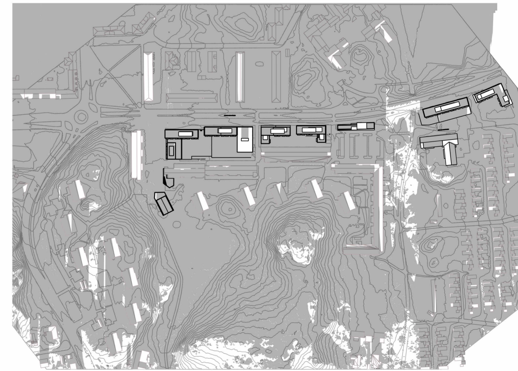
21 DEC - KL. 15 - Plan