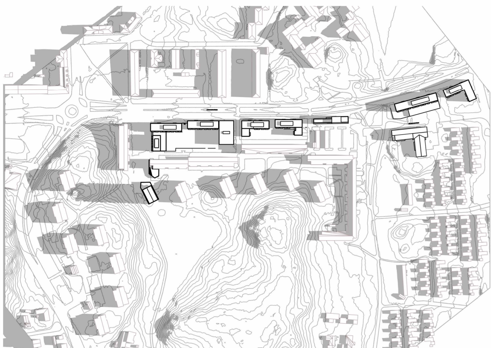
21 MARS - KL. 9 - Plan