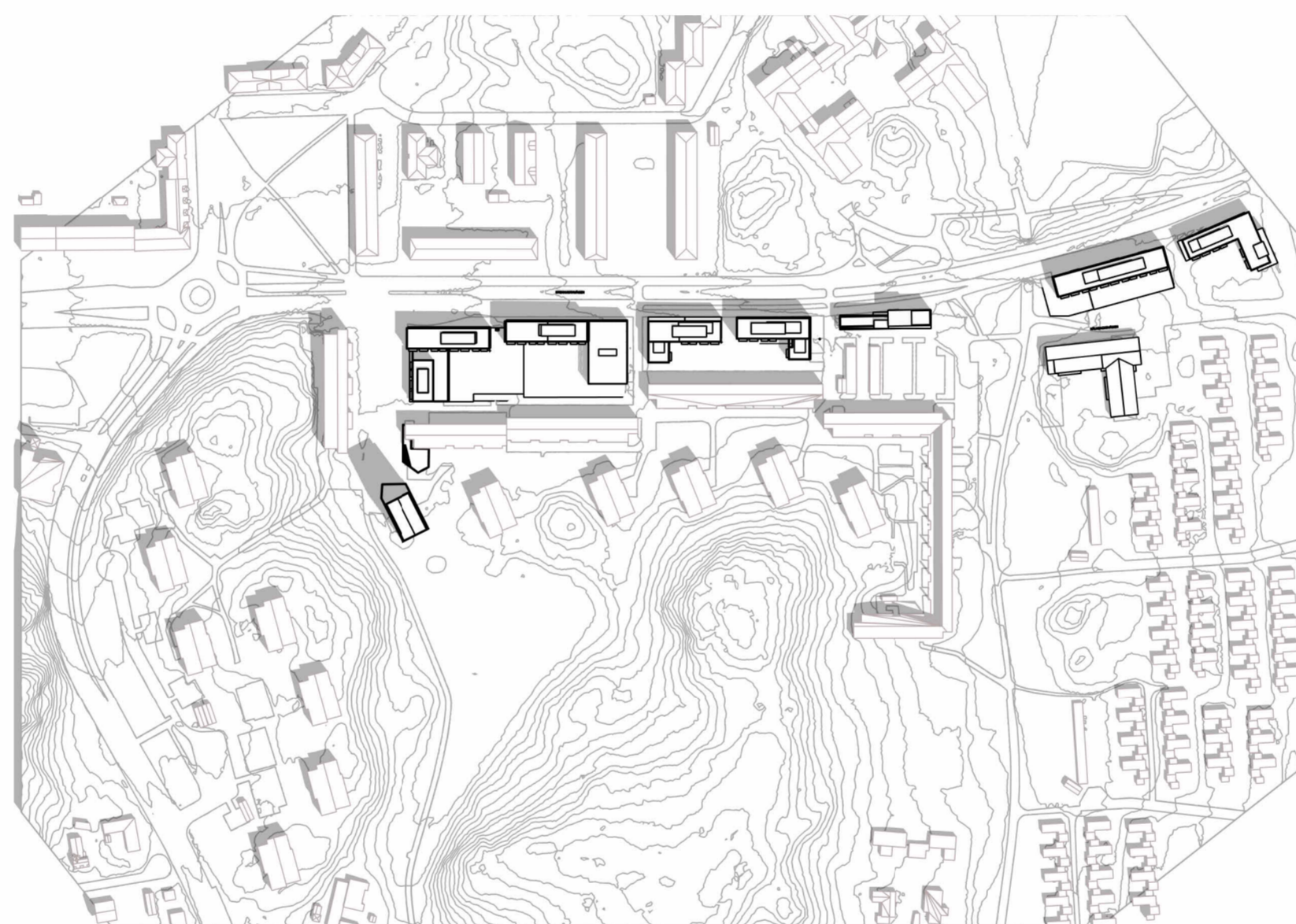
21 JUNI - KL. 12 - Plan