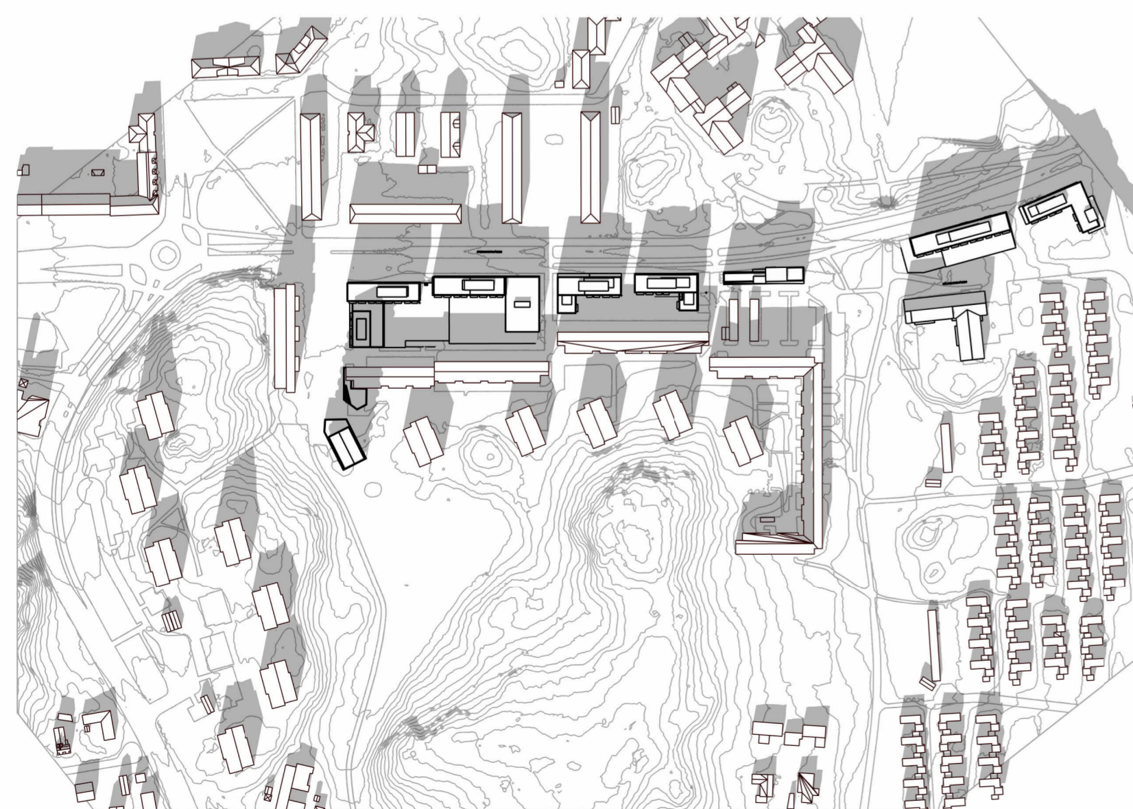
21 MARS - KL. 15 - Plan