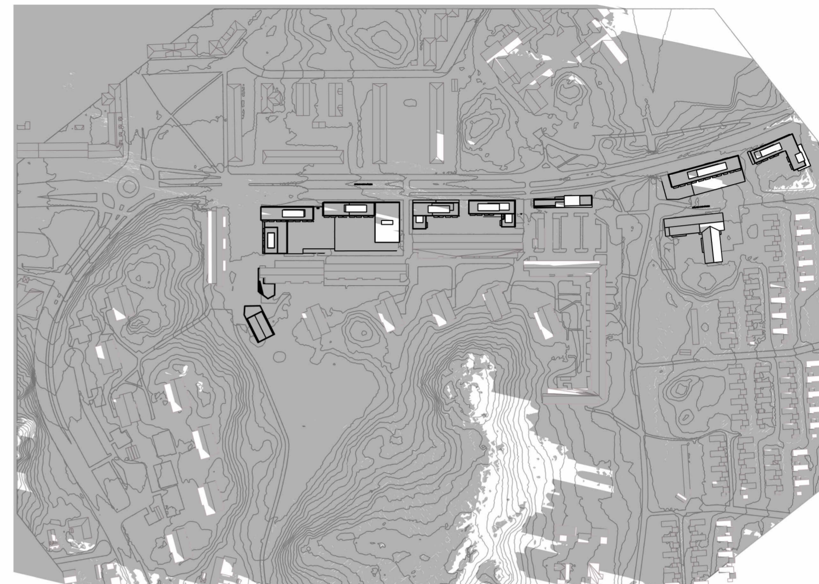
21 DEC - KL. 9 - Plan